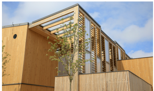
Pop Acte, lauréat 2022 dans la catégorie Logement collectif

Le Prix National de la Construction Bois s'impose progressivement comme le concours de référence du bâtiment durable et bas carbone, avec un nombre de candidatures en hausse de 26 % par rapport à 2022 et 47 % sur les cinq dernières années . Un engouement qui se mesure partout en France, avec notamment des augmentations particulièrement marquées depuis 2018 du nombre de projets en Bretagne (+ 130 %) et dans les Hauts-de-France (+ 580 %).