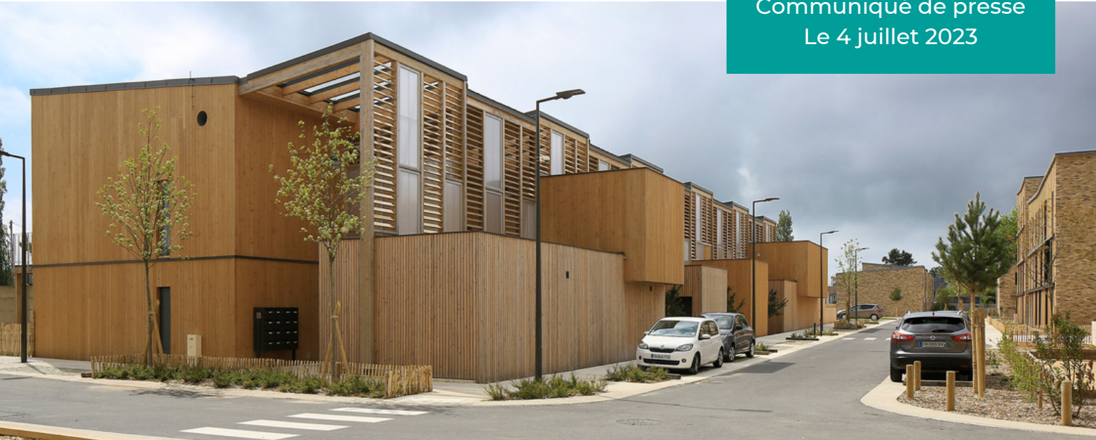
Pop Acte, lauréat 2022 dans la catégorie Logement collectif

La 12 e édition du Prix National de la Construction Bois (PNCB) est marquée par une montée en puissance du concours au sein de la filière. Le nombre de candidatures (691) est en hausse de 47 % par rapport à 2018 , symbole d'une démocratisation des usages de ce matériau chez les professionnels de la construction, et dans un contexte de transition écologique.